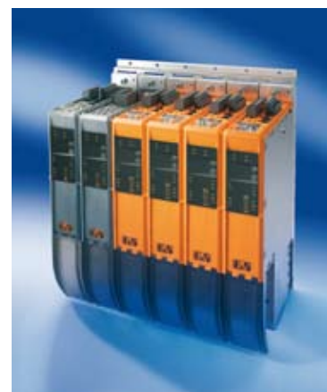
B&R Automation a fait le choix de s'implanter en Rhône-Alpes pour se rapprocher d'un bon nombre de ses clients

La société Ades Technologies, quant à elle, réalise la moitié de son chiffre d'affaires à l'ex-