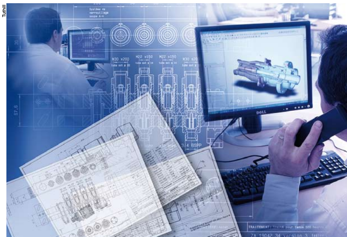
La région Rhône-Alpes est particulièrement bien dotée en termes de R&D