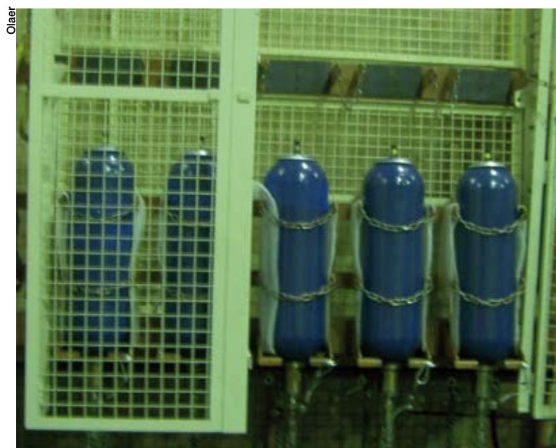
L'agence Olaer de Vaulx-en-Velin a pris la décision de s'implanter après une étude sur le potentiel régional

De nombreux intervenants de la profession des transmissions s'accordent d'ailleurs à relever