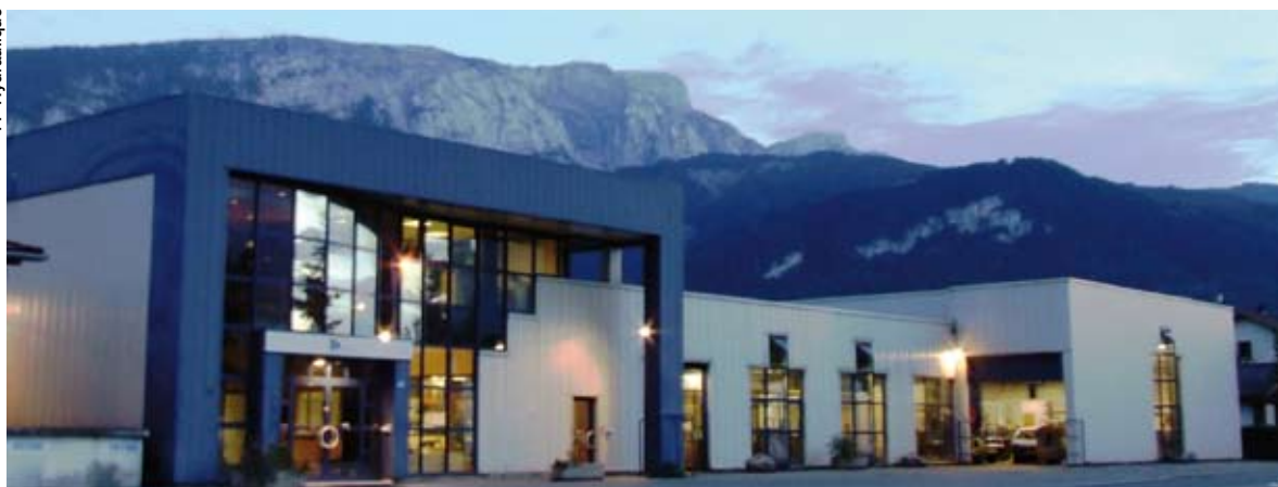
La majorité des partenaires et sous-traitants de la société FP Hydraulique se situent en région Rhône-Alpes et en périphérie