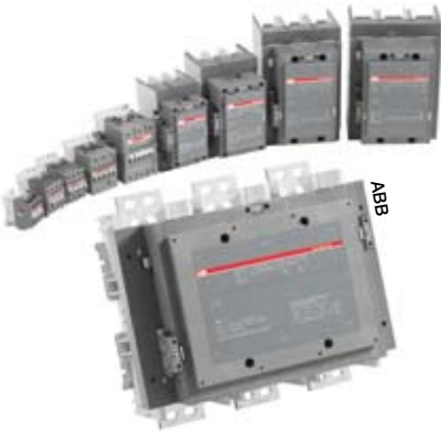
Les cinq grands métiers d'ABB sont présents en Rhône-Alpes

« a fait le choix de s'implanter en Rhône-Alpes pour être proche géographiquement d'un bon nombre de ses clients », explique Olivier Rambaldelli, responsable Marketing. B&R Automation se fait fort de proposer une réponse adaptée, basée sur des solutions intégrées en automatisation et une gamme