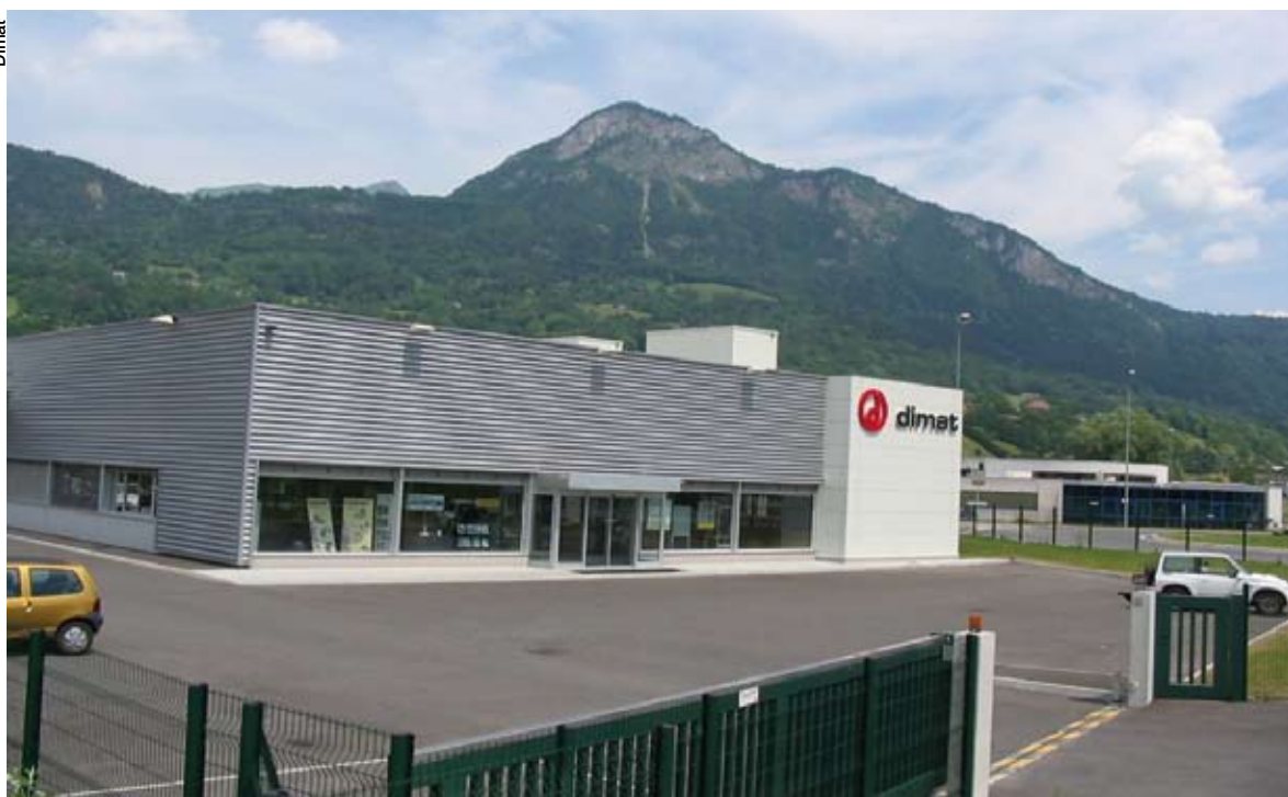
« On trouve en Rhône-Alpes une concentration de compétences qui profite à tous les acteurs de la profession », constate la société Dimat