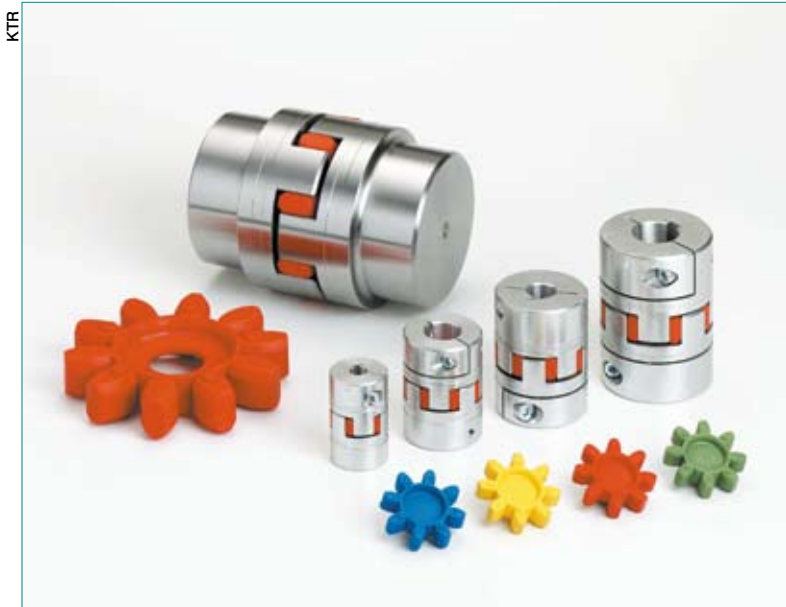
KTR France insiste sur la situation géographique centrale de la région qui permet de développer une action nationale et internationale

Chez KTR France, Stéphane Caillet insiste sur « la situation géographique centrale d'une région particulièrement bien desservie qui permet de développer une couverture commerciale nationale ».