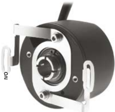
Le boîtier en composite polyamide/fibre de carbone des codeurs G1341 et G1342 de IVO Industries est très léger, résiste aux chocs et protège l'électronique des perturbations électromagnétiques comme une cage de Faraday.

« Le problème, c'est quand on combine tous les facteurs extrêmes : les améliorations du futur sont là »