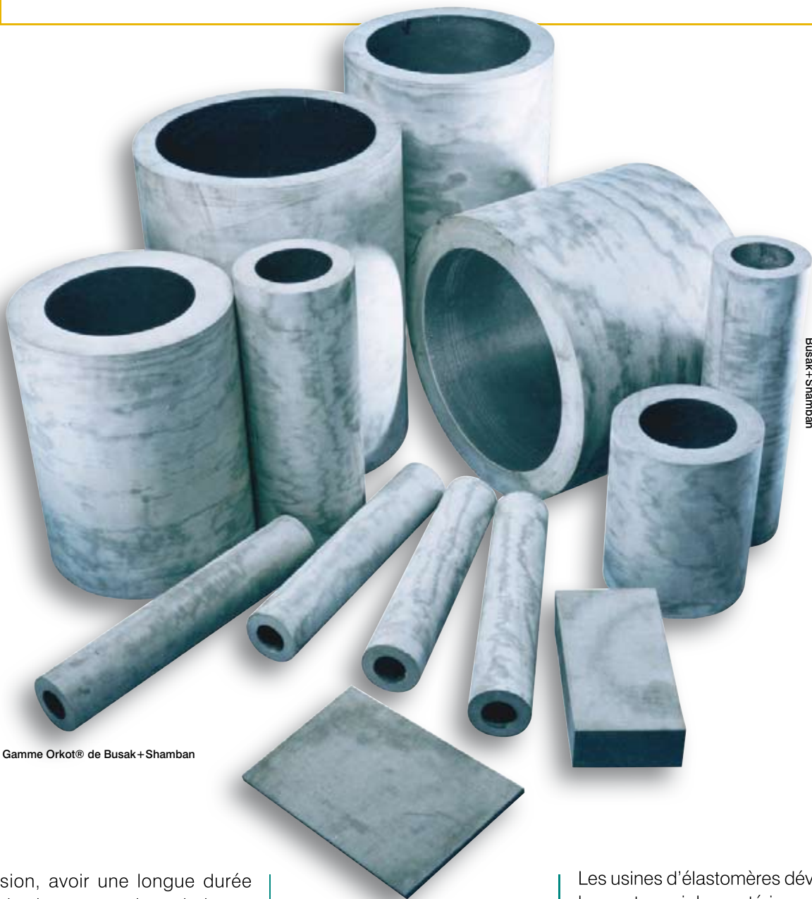
Gamme Orkot® de Busak+Shamban