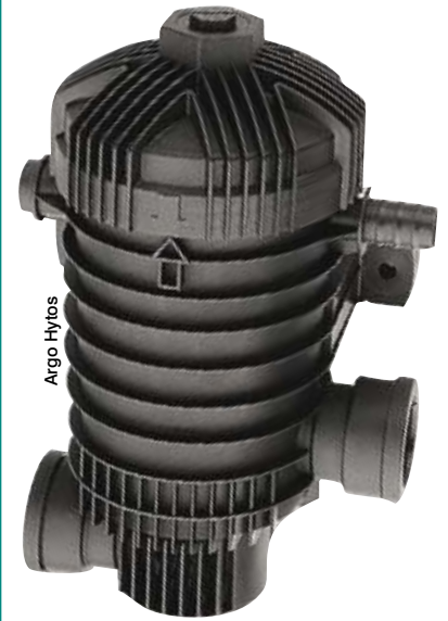
Le premier filtre retour « tout plastique » d'Argo Hytos a fait évoluer également sa connectique : il n'est plus besoin de raccord à visser : le flexible est directement branché sur le filtre !

leurs applications se multiplier. Les premiers investissent roulements et galets, les seconds pourraient bien figurer les réservoirs et tuyauteries de demain. « Pour les céramiques nanostructurées, on obtient bien une dureté élevée, mais accompagnée d'un comportement ductile très favorable aux applications mécaniques », soulignent les experts du Cetim. Avec le projet R&D TransNanoPowder, des prototypes de galets et de roulements à bagues en céramiques nanostructurées ont montré une meilleure capacité de charge et de résistance à l'usure que les mêmes en céramique... classique ! En l'absence de lubrification, le couple de frottement était plus faible que celui des roulements de référence. L'avantage mis en