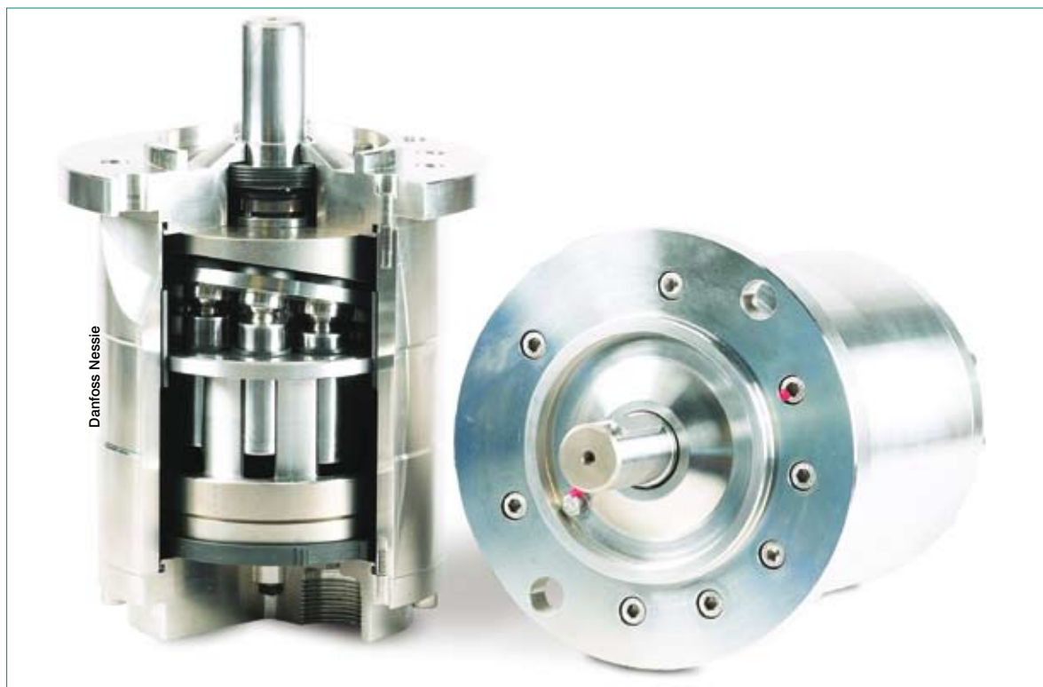
Les pompes Danfoss Nessie sont lubrifiées par de l'eau sans aucun additif ou d'autres fluides à très faible viscosité. Pour le supporter, les surfaces de frottement sont réalisées en «plastique» ou en acier inoxydable recouvert de polymères, afin de favoriser la formation de films hydrodynamique et statiques entre les pièces mobiles.

évidence ne devrait pas tarder à faire des émules.