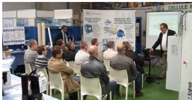
Pall a expliqué les différentes sources de pollution particulaire et aqueuse d'un circuit et donné ses solutions pour la combattre grâce à une filtration et des moyens de mesure appropriés.

Eqhyp s'efforce d'ailleurs de veiller en permanence au bon fonctionnement des installations de ses clients. La maintenance curative et préventive, qu'elle soit assurée par des interventions ponctuelles ou dans le cadre de