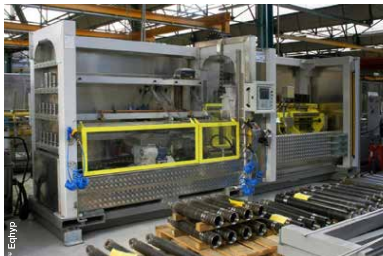
De grands donneurs d'ordres ont décidé de faire confiance à Eqhyp pour la prise en charge de leurs projets.

Quant aux bancs didactiques, ils sont destinés à l'enseignement et intègrent plusieurs technologies telles qu'hydraulique, pneumatique, électricité et régulation PID. Enfin, Eqhyp a été amenée à intervenir sur des projets de systèmes de transfert (convoyeurs),