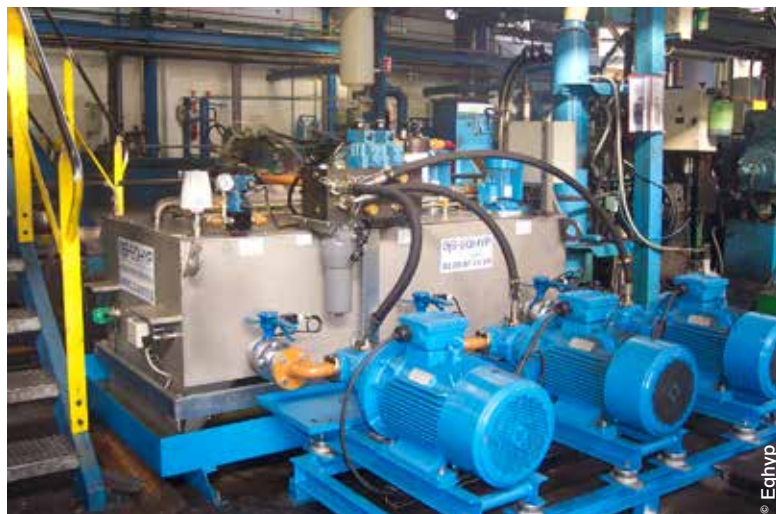
La conception et la fabrication de systèmes combinant plusieurs technologies – hydraulique, pneumatique, mécanique, automatismes industriels – constituent également un des points forts de la société champenoise.

Cet ensemble de capacités acquises et développées au fil du temps, a incité Eqhyp à mettre en place un Département Ingénierie spécialisé dans la réalisation de moyens d'essais et de machines spéciales pour le compte de ses clients, en conformité avec les cahiers des charges et les réglementations en vigueur. « Le développement d'Eqhyp est en grande partie basée sur la réalisation de bancs d'essais, précise Eddy Go-