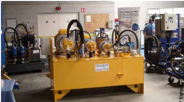
La conception, la fabrication et le retrofit de groupes hydrauliques occupent une place importante dans les interventions d'Eqhyp.

contrats annuels, a toujours fait partie de ses priorités. Les interventions effectuées sur les machines se traduisent par la remise d'un rapport d'analyse prenant en compte les aspects fonctionnels, sécuritaires ou environnementaux et débouchent sur des propositions de réparations, de mises en conformité, voire d'améliorations. Retrofit de groupes hydrauliques, mises en place de blocs forés et d'équipements en cartouches, réalisation de coffrets pneumatiques, interventions sur des centrales d'air comprimé, définition de solutions de filtration ou de refroidissement... autant de prestations qui s'ajoutent à la panoplie proposée par Eqhyp.