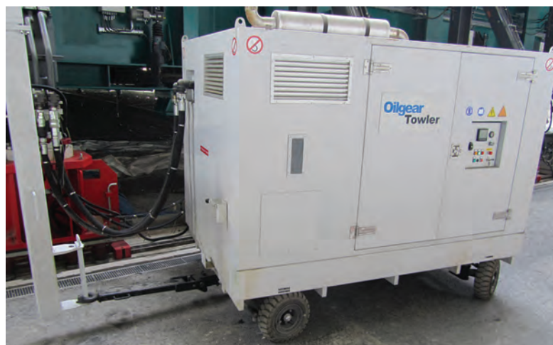
Deux centrales hydrauliques mobiles dotées chacune d'un réservoir de 1.000 litres et d'une pompe à cylindrée variable, type PVV entraînée par moteur thermique, suivent le plateau sur chacun de ses côtés.

« "Levage", "translation" et "compensation" sont les trois mots clés de ce projet d'envergure »