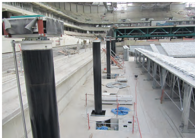
Plutôt que de centraliser la génération hydraulique en un seul lieu, il a été préconisé de doter d'une centrale hydraulique indépendante chacun des 12 vérins de levage fournis par Douce Hydro. © ELISA - Valode et Pistre Architectes - Atelier Ferret Architecture - EIFFAGE TP - Oilgear Towler

trictifs, auxquels s'ajoutent des capteurs de pression ainsi qu'un capteur installé en bout de terrain afin de mesurer l'avancement du plateau.