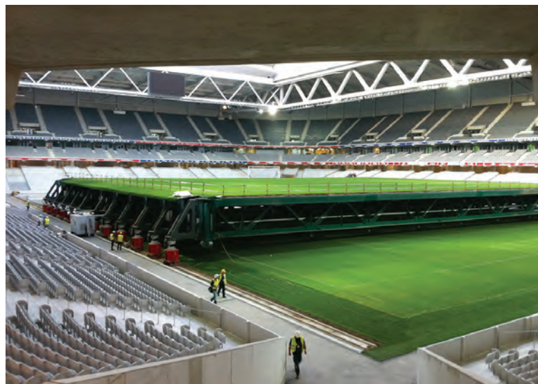
Le défi consistait à concevoir un système permettant d'assurer l'élévation et le déplacement d'un demi-terrain d'une longueur de 70 mètres sur une largeur de 55 mètres et d'un poids total de quelque 4.500 tonnes.