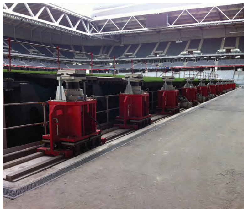
Un système mobile réalisé par NFM, en l'occurrence des chariots coulissant sur des rails à l'aide de galets, est utilisé pour la translation.

dante chacun des 12 vérins de levage fournis par Douce Hydro et disposés de part et d'autre du demi-terrain (soit six vérins de chaque côté). Une solution qui permet de gérer plus finement le fonctionnement de chaque actionneur afin de hisser de façon harmonieuse l'ensemble de la structure à une hauteur de 5,70 mètres à la vitesse de 1,3 mm/seconde ! « En dotant chaque vérin de levage de sa propre centrale, avec des pompes Oilgear Towler à pistons 100% volumétriques (moins de 1% d'écart), le risque est minimisé lors de l'opération de levage. En cas de problème sur un vérin, sa charge peut être reprise par les autres. Si besoin, l'ensemble pourrait même fonctionner avec dix vérins seulement, soit cinq de chaque côté »,