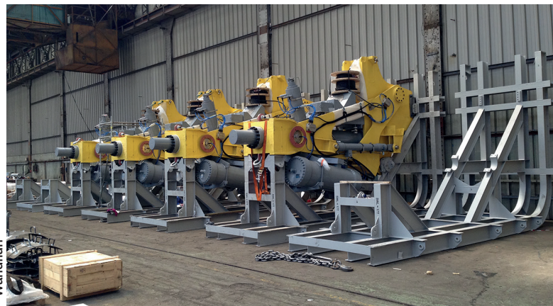
D'importants projets sont en cours de développement par la filiale française, notamment la réalisation de systèmes de désengagement rapide de FPSO, sur le champ pétrolier Stones de Shell dans le Golfe du Mexique.

L'entreprise suisse répond aussi aux besoins de nombreux clients dans le domaine de l'énergie à qui elle fournit des valves utilisées pour la régulation de clapets à vapeur, le réglage des pales de rotors dans l'éolien, la commande de freins à disque, la régulation de turbines sur les barrages hy-