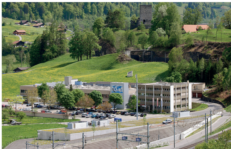
Quelque 8 millions d'euros vont être consacrés au projet d'extension de 50% de la superficie de l'usine de Frutigen. Le lancement des travaux est prévu dès le printemps 2016.

A l'aube de son 70 ème anniversaire, Wandfluh est toujours détenue par la famille du fondateur. Alors que la troisième génération se tient prête à prendre les commandes, l'entreprise suisse veille jalousement sur son indépendance et envisage l'avenir avec confiance. L'extension de l'usine de Frutigen est prévue à l'horizon 2016 tandis que le groupe travaille à son développement à l'international. Au programme de la filiale française : une diversification de la clientèle et un renforcement de la coopération avec les intégrateurs locaux.