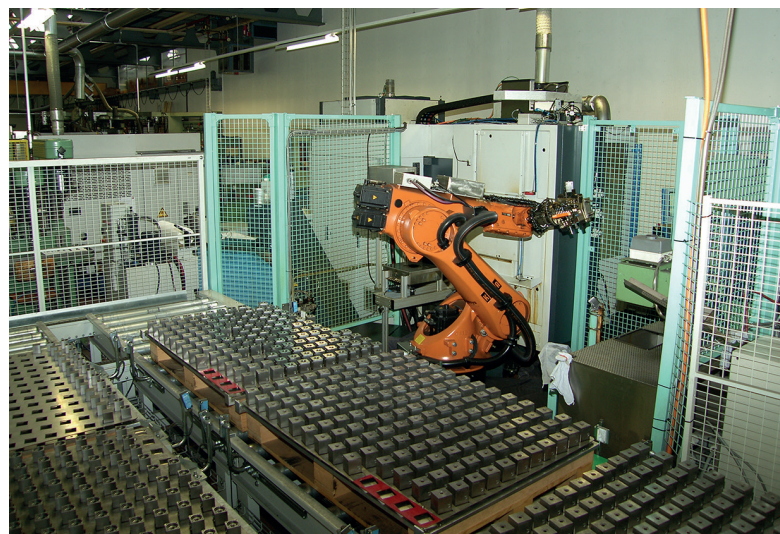
Les machines à commande numérique et cellules robotisées équipant l'usine de Frutigen tournent pour la plupart 24h/24 et 7j/7.

L'usine de Frutigen, dans le canton de Berne, constitue le reflet fidèle de cette volonté. Implan-