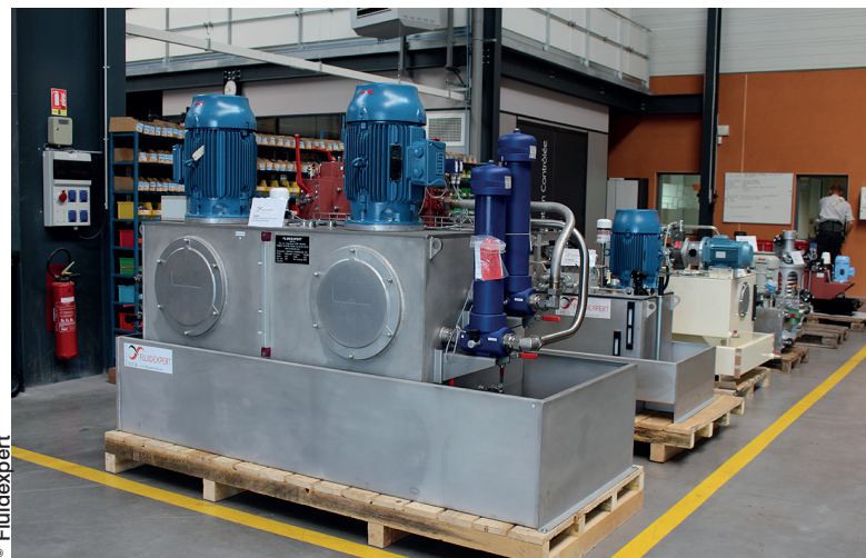
Le groupe Inicia se positionne en tant que spécialiste de la transmission de puissance et du contrôle-commande.

Une dizaine de personnes sont employées au sein du bureau d'études de l'entreprise, où elles travaillent à l'aide de plusieurs logiciels de conception et de simulation telles que Solidworks ou Automation Studio. Le nouveau site est également équipé d'un laboratoire d'analyse de fluides dotés de matériels fournis par la société Pall, partenaire historique de l'entreprise qui a implanté une quinzaine de ces « laboratoires de proximité » au sein de son réseau de distribution