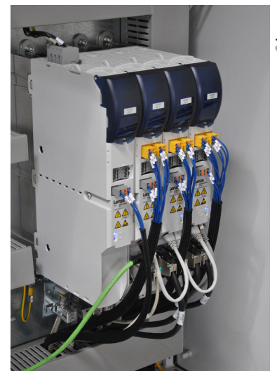
Servovariateurs i700 multi-axes avec module alimentation en tête commandés via bus EtherCAT.

Conforme à la classe de rendement IE2 selon la norme EN 50598-2, le nouveau variateur de vitesse i500 témoigne, lui aussi, de la volonté de Lenze de « ne pas faire payer aux clients des