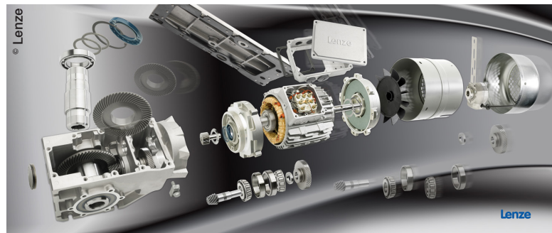
Les réducteurs g500 se caractérisent par des forces radiales admissibles élevées, des rapports de réduction finement échelonnés et un jeu angulaire réduit.