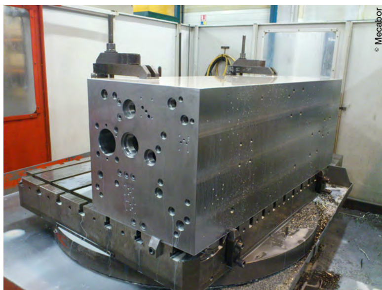
L'atelier va être réorganisé afin d'accueillir une machine cinq axes permettant de manutentionner des blocs pesant jusqu'à dix tonnes, ainsi que trois centres d'usinage horizontaux dotés de systèmes de palettisation et desservis par un magasin automatique commun riche de 3.000 outils.

Fragilisé par un important passif et placé en liquidation judiciaire début 2016, Mecabor et 35 de ses salariés (sur un effectif total de 69 personnes) viennent d'être repris par le groupe familial Lorinvest, séduit par le potentiel que représente l'entreprise vendéenne et les possibilités offertes par son intégration au sein d'un groupe très actif dans le domaine industriel. De fait, le holding 100% familial dirigé par Eric Lorin chapeaute notamment Walor International, entreprise de 450 personnes réalisant un chiffre d'affaires de 52 millions d'euros dans les domaines de l'usinage et du décolletage. Walor dispose de trois sites en France et deux autres